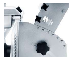
Schlittenneigung für unterschiedliche Scheibengrößen einstellbar